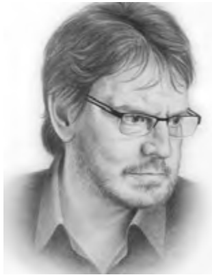
Por Felipe Pigna

Nunca pensaron los dueños del granero que, junto con el ejército de desocupados y la mano de obra barata, estaban importando la rebelión. Su soberbia no les dejaba pensar que no se podía prometer a los hambrientos de Europa, a los desheredados de toda herencia, la felicidad, el pedazo de tierra, el trabajo que les permitiera mantener a su familia, para luego someterlos a las peores condiciones de miseria y humillación.